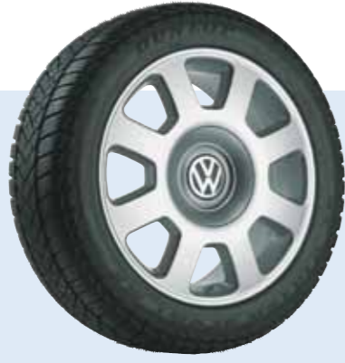
VW Champion Volkswagen Original Zubehör