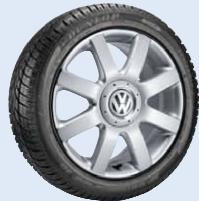
VW Meribel Volkswagen Original Zubehör