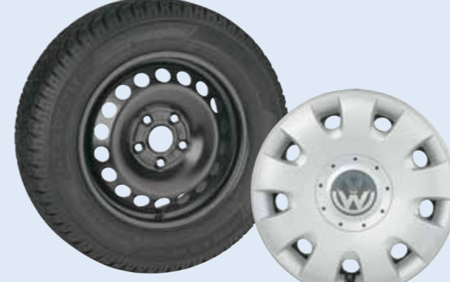
Original Volkswagen Stahl-Winter-Komplettrad ab € 429,-

Original Volkswagen Radzierblende ab € 58,10 pro Garnitur