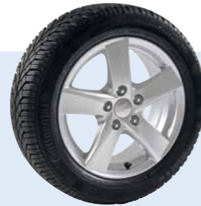
AZW Dolomit ab € 619,-