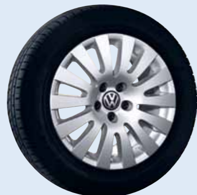
VW Imagine Volkswagen Original Zubehör