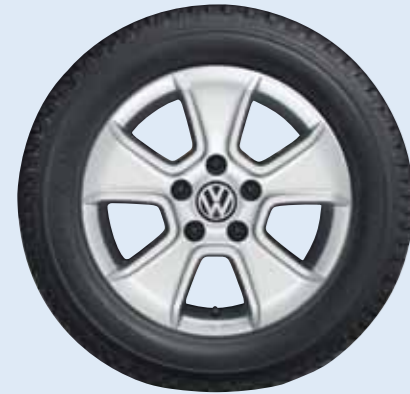
VW Amazonit Volkswagen Original Zubehör