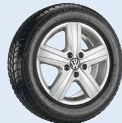
VW Thunder Volkswagen Original Zubehör