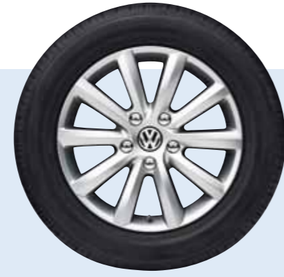
VW Tacora Volkswagen Original Zubehör