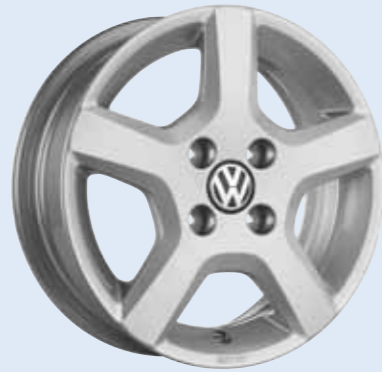
VW Larna Volkswagen Original Zubehör