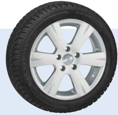
AZW Alaska ab € 539,-