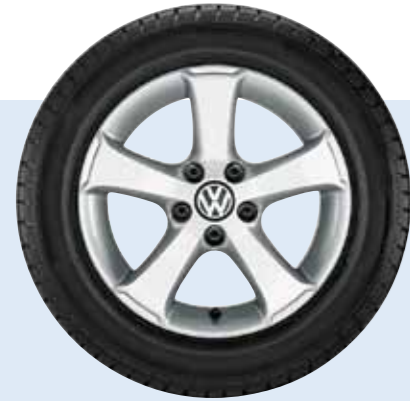
VW Sima Volkswagen Original Zubehör