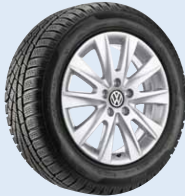
VW Los Angeles Volkswagen Original Zubehör

Original Volkswagen Radzierblende ab € 58,10 pro Garnitur